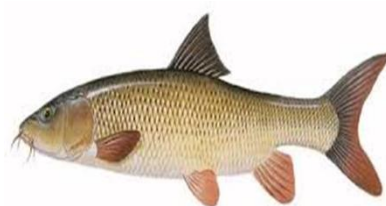
شکل ۹: سس ماهی سرگنده