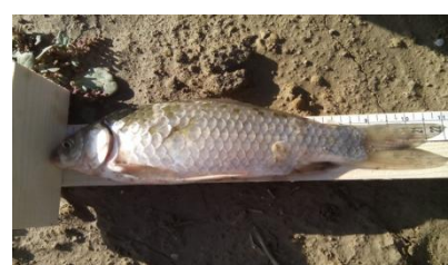
شکل ۶: کاراس