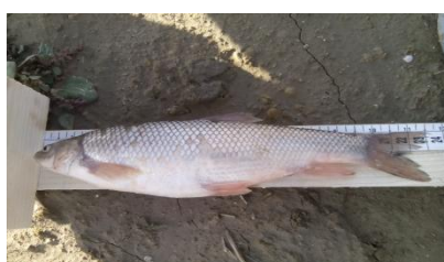
شکل ۷: سیاه ماهی