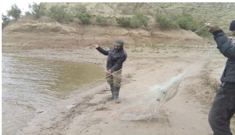
شکل ۲: نمایی از آماده سازی تور گوشگیر در سد بوستان