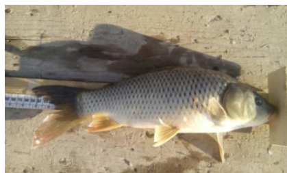
شکل ۵: کپور معمولی

۷۵۹ قطعه ماهی با تور گوشگیر در ۴ فصل صید شد. به نحوی که در فصل زمستان ۱۳۹۷ (۱۴۱ قطعه) بهار ۱۳۹۸ (۶۸ قطعه) تابستان ۱۳۹۸ (۲۰۳ قطعه) و پاییز ۱۳۹۸ (۳۴۷ قطعه) از انواع گونه‌های کپور معمولی ( Cyprinus carpio )، سیاه ماهی ( Capoeta razii )، کاراس ( Carassius gibelio )، کپور علفخوار یا آمور ( Ctenopharyngodon idella )، کپور نقره‌ای یا فیتوفاگ ( Hypophthalmichthys molitrix )، کپور سرگنده یا بیگهد ( Hypophthalmichthys nobilis ) و سس ماهی سرگنده ( Lucio barbus ) صید شد (شکل‌های ۱ تا ۹). اطلاعات مربوط به ماهیان صید شده با تور گوشگیر بر اساس تعداد ماهی صید شده در جداول ۱، ۲، ۳ و ۴ ارائه شده است.