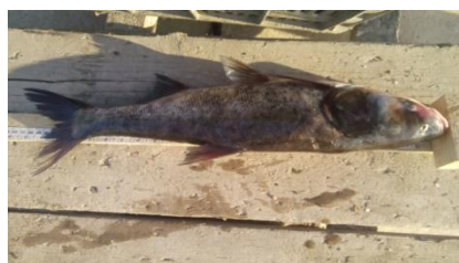
شکل ۸: کپور سرگنده یا بیگ هد