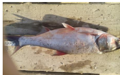
شکل ۳: کپور نقره‌ای یا فیتوفاگ