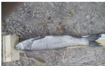
شکل ۴: کپور علفخوار یا آمور